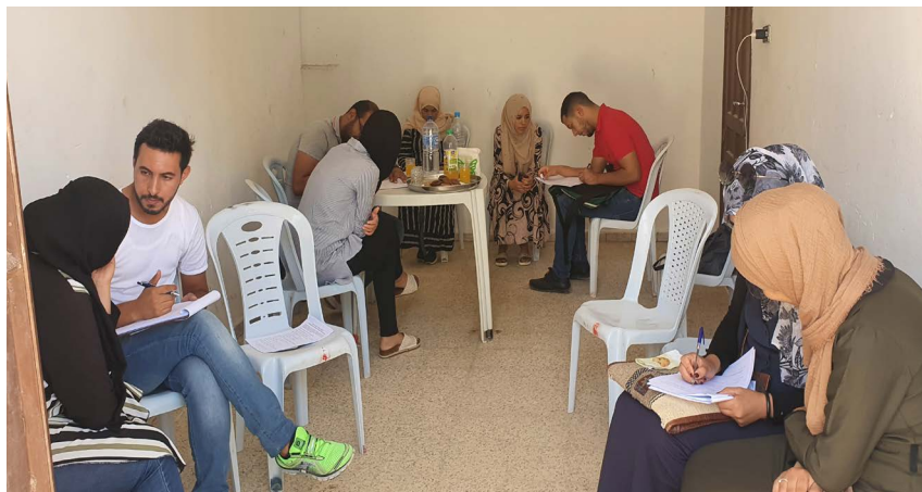
Photo 2 : Enquête auprès des femmes, au sein d'un local d'un Groupement de développement agricole (GDA), dans la localité rurale de Ksar Jraa à Beni Khedache, septembre 2020.