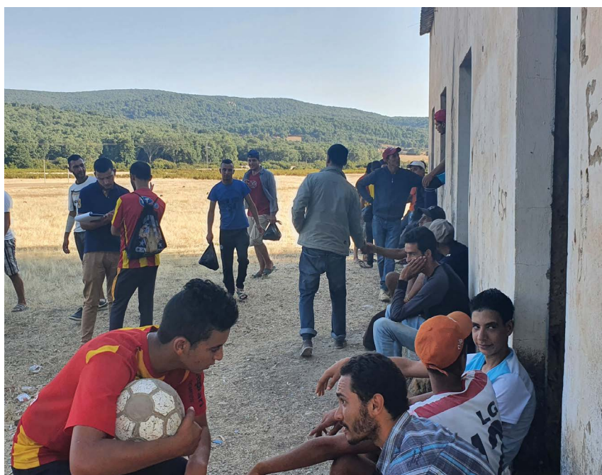
Photo 1 : Enquête auprès de jeunes avant un match de football à Aïn Draham Oued Zen, juillet 2020.

Cette approche, novatrice dans le contexte de déconfinement et vu les contraintes de terrain, a permis de soumettre le questionnaire à 1 004 jeunes hommes et femmes sur une période allant du 20 juillet au 20 septembre 2020. Il est nécessaire de rappeler que les communes servant de support à cette recherche se situent dans des zones frontalières de la Tunisie de l'intérieur. Par conséquent, il a fallu obtenir des autorisations pour pouvoir interroger les jeunes au sein des espaces publics, qu'ils soient urbains ou ruraux. L'imbrication de notre recherche à une composante opérationnelle d'un programme de coopération internationale associant les communes n'a pas été suffisante pour nous garantir, à la fois, un accès aux territoires et aux populations qui y résident. En ce qui concerne les espaces frontaliers, ce sont les aspects sécuritaires qui ont primé sur toute autre considération et nous avons donc été orientés vers l'institution du gouvernorat, siège du pouvoir politique et de la puissance publique. Bien que depuis 2011, les projets de coopération internationale et les programmes de recherche aient contribué à familiariser les pouvoirs régionaux avec ce type d'enquête, le contexte géographique et l'optique des no man's lands , caractérisant les espaces reculés d'Aïn Draham,